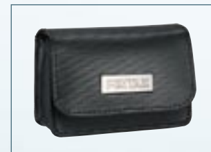
Ledertasche Optio S5z